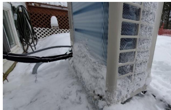
Рис. Наружный блок с замерзшим теплообменником

Для борьбы с обмерзанием кондиционеры автоматически переходят в режим «оттайки», растапливая лед. Образовавшаяся при этом вода сливается через отверстие в нижней части наружного блока в дренажную систему.