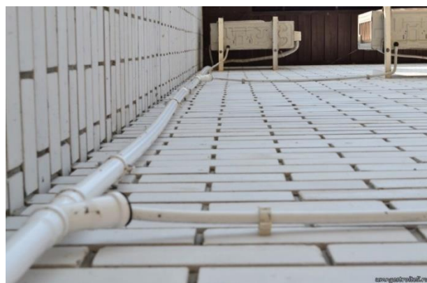
Рис. Такого варианта отвода конденсата в СП нет

Обращаем внимание, что нормативы допускают прокладку стояков дренажа снаружи только в одном исполнении – в толщине утеплителя фасада, и только из чугунных труб с электрообогревом. Прокладку стояков в мокром фасаде или же по внешней стороне нормативная документация не предусматривает.