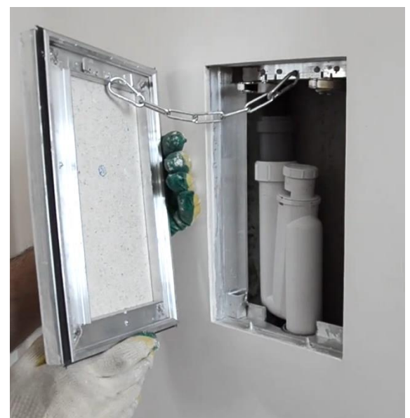
Рис. Лючок напротив гидрозатвора при подключении к стояку

6.5.9 На трубопроводах системы удаления конденсата следует предусматривать установку ревизий (прочисток). При скрытой прокладке трубопроводов против ревизий на стояках следует устанавливать ревизионные люки.