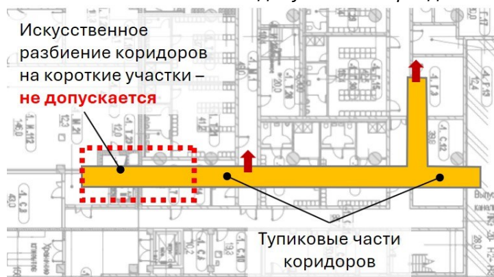
Рис. Разбивать коридор на участки менее 15 м, чтобы избежать дымоудаления, запрещено

3.12 тупиковый коридор: Коридор (часть коридора), эвакуация из которого возможна только в одном направлении.