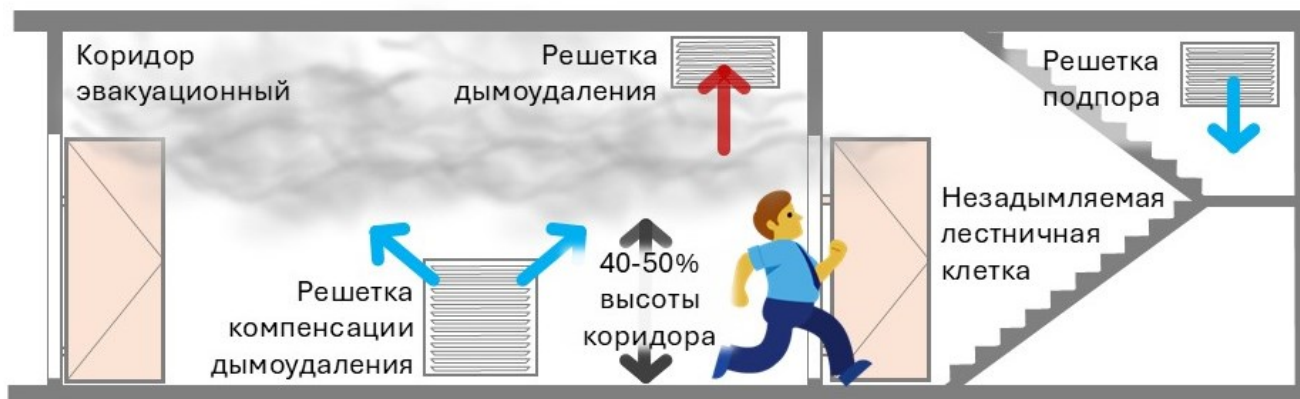
Рис. Совместная работы дымоудаления и компенсации в коридоре, подпора в лестничную клетку