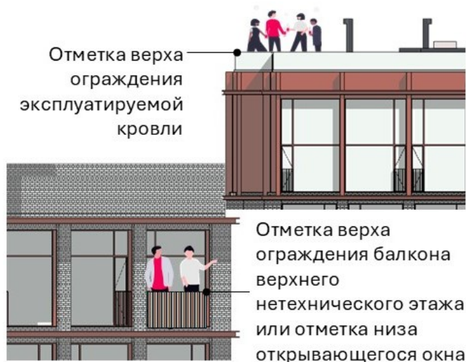
Рис. Пожарно-техническая высота здания

Обратите внимание, что 28 метров – это пожарно-техническая высота , а не архитектурная. Пожарная высота измеряется от уровня подъезда пожарного автомобиля до верхней точки нахождения людей при пожаре. За такую верхнюю точку принимается нижняя граница открывающегося окна последнего нетехнического этажа, верх ограждения балкона такого этажа или верх ограждения эксплуатируемой кровли.