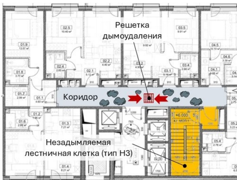
Рис. Дымоудаление коридора, сообщаемого с незадымляемой лестничной клеткой

Как мы знаем, коридоры длиной менее 15 м могут не оснащаться системами дымоудаления. Однако, искусственное разбиение коридоров с помощью дверей на такие короткие участки, чтобы избежать дымоудаления – не допускается. Эта «уловка» не работает.