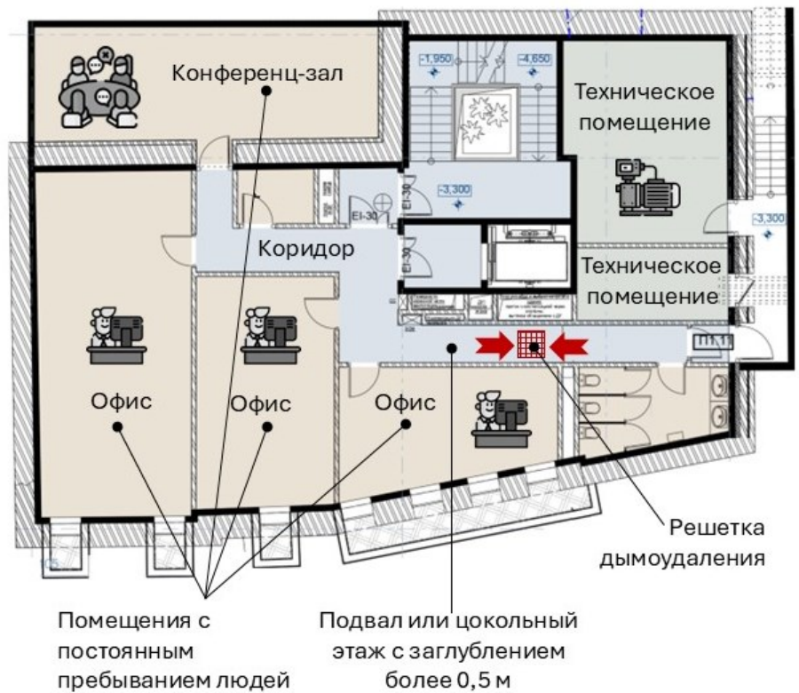
Рис. Дымоудаление подвального этажа

Напомним, что такое помещение с постоянным пребыванием людей: Помещение, в котором предусмотрено пребывание людей непрерывно в течение более двух часов (Технический регламент о безопасности зданий и сооружений, ст.2, п.15)